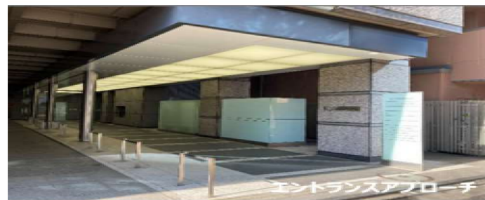
エントランスアプローチ