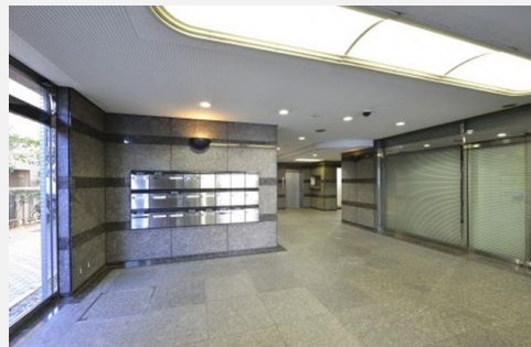
● 1階エントランスホール