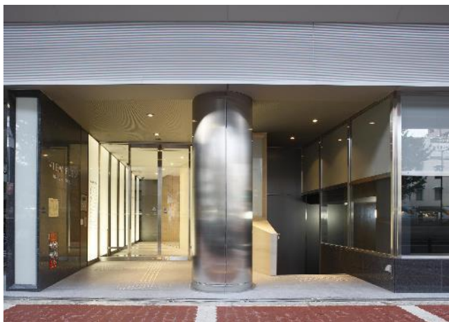
▲ エントランス外観