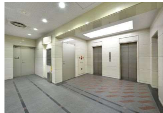
●エントランスホール