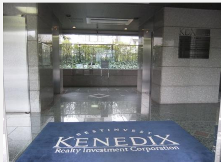
● 1階エントランスホール