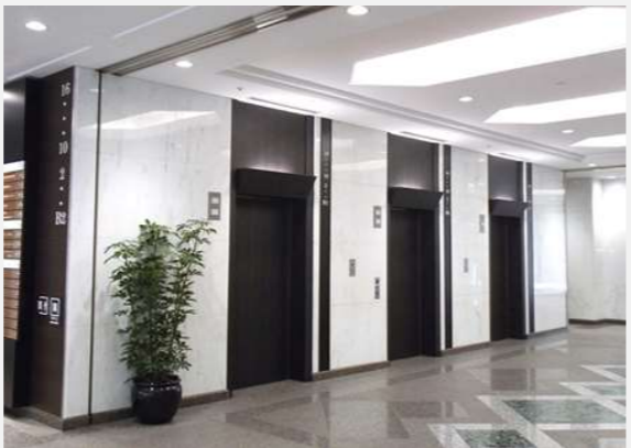
1階エレベーターホール