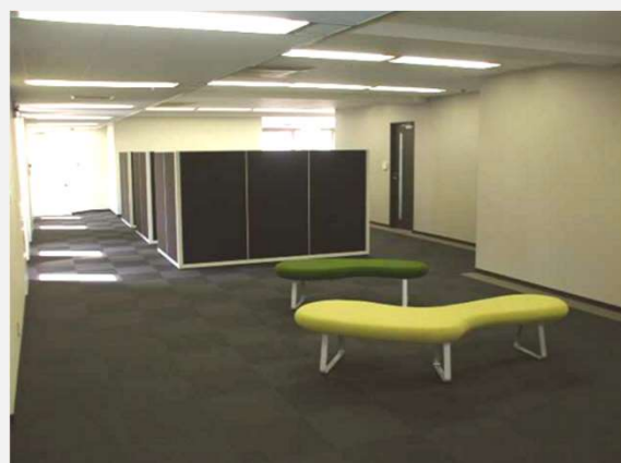
共用打合せブース