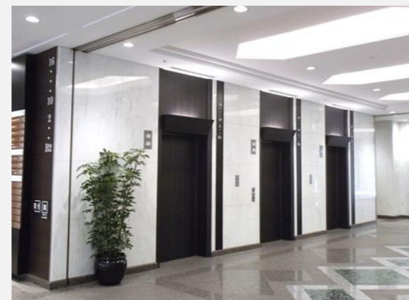
1階エレベーターホール