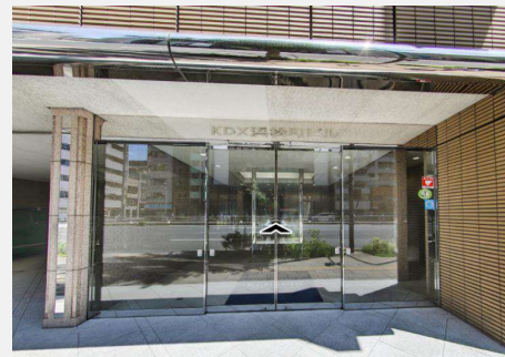
正面エントランス