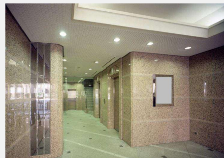
1階エレベーターホール