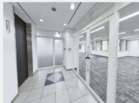
基準階エレベーターホール