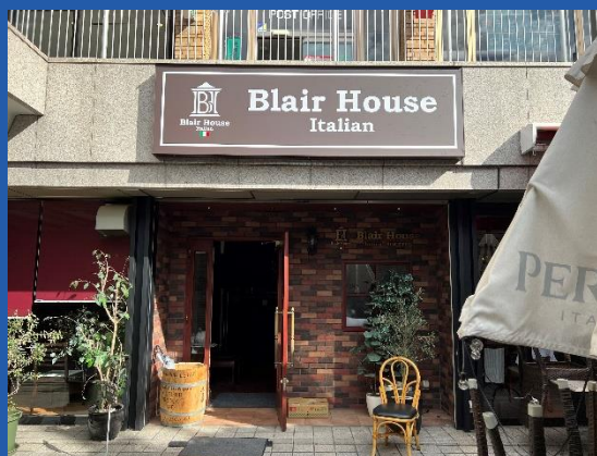
Blair House (イタリアンレストラン)