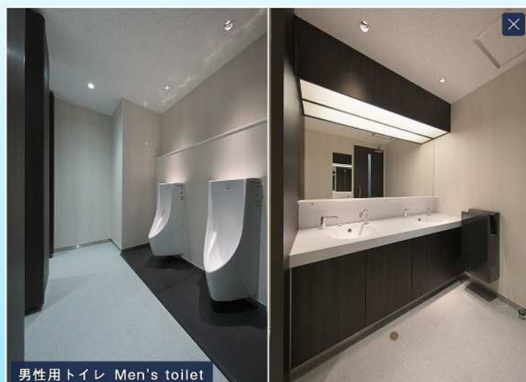
男性用トイレ Men's toilet