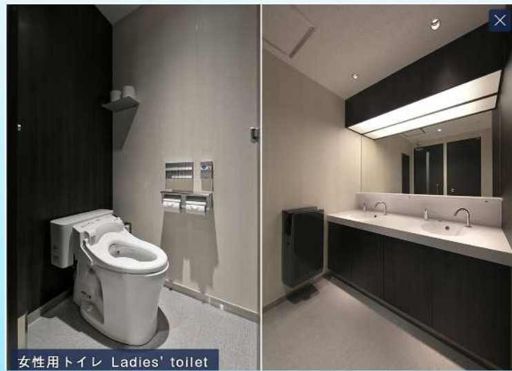
女性用トイレ Ladies' toilet