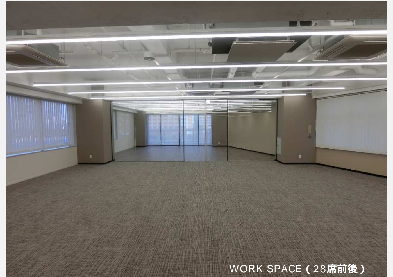
WORK SPACE (28席前後)