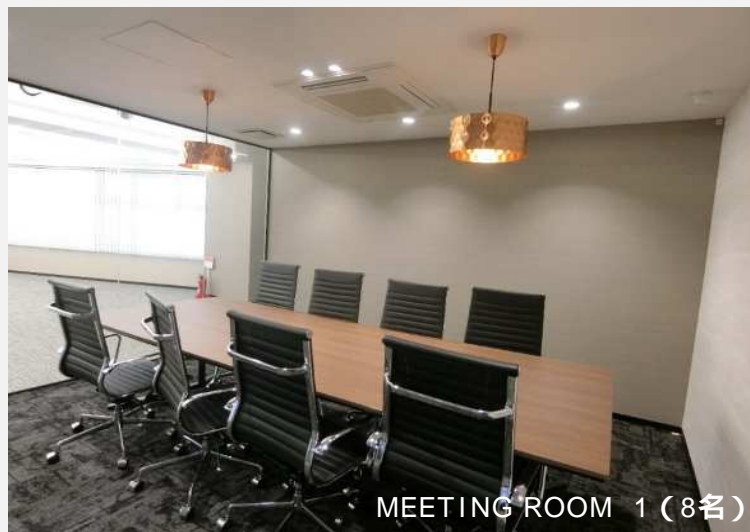
MEETING ROOM 1 (8名)